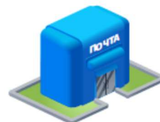
Отделения почтовой связи

Всю дополнительную необходимую информацию о телевизионном вещании в Алтайском крае Вы также можете получить по телефонам: 8 (3852) 50-64-98 – центр консультационной поддержки Алтайского филиала РТРС