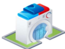
Магазины бытовой техники