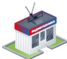
Магазины на рынке радиотехники